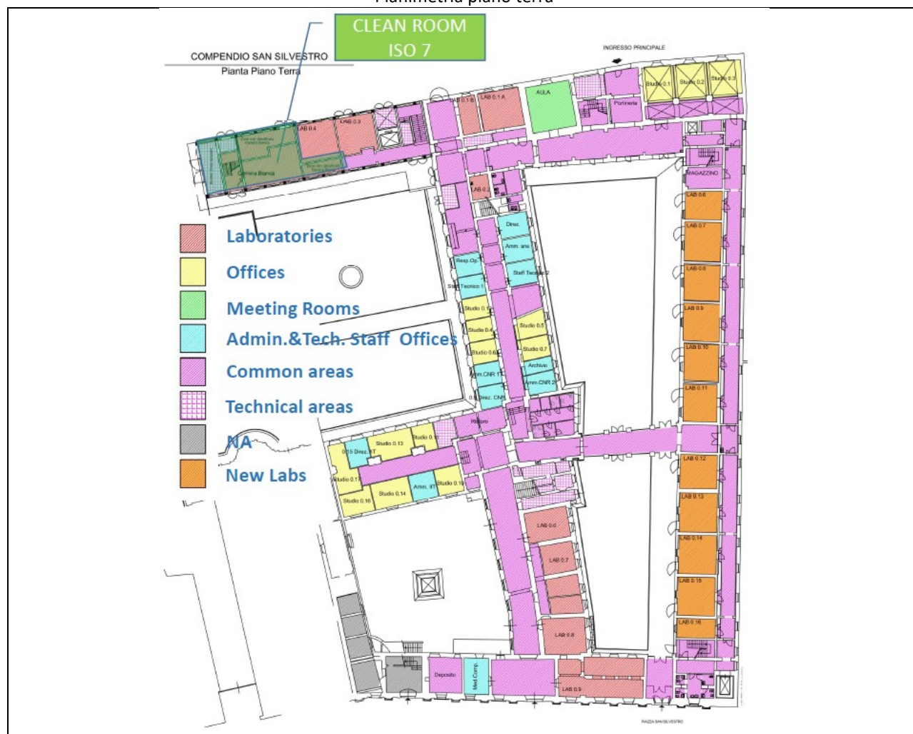
Planimetria Laboratorio 0.4