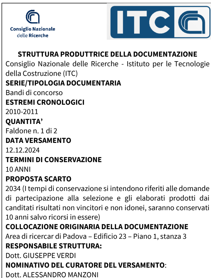
Fig. 3 - Modello etichetta da predisporre sugli scatoloni che conservano i faldoni che si fornisce a titolo di esempio

4. La documentazione, dopo l'etichettatura, deve essere ordinatamente inserita nelle scatole di formato non superiore a 60x40x40 cm. con peso possibilmente non superiore ai kg. 12 circa o se sciolta (non conservata in faldoni) direttamente nelle scatole al fine di facilitare la movimentazione, il trasporto e l'ordinamento del materiale nelle scaffalature. Le scatole di dimensioni non standard, salvo eccezioni, non possono essere trasferite e conservate nell'archivio. Non può essere accettato il versamento di documentazione mista, non riordinata o non adeguatamente predisposta. Se chi predispose la documentazione per il versamento in archivio (il referente o altro personale del Servizio/Unità operativa a ciò incaricato) individua tipologie documentarie o tipologie di fascicoli mancanti nel Massimario di conservazione dell'Ente deve avvertire il Responsabile della Gestione Documentale al fine di aggiornare il Piano di conservazione.