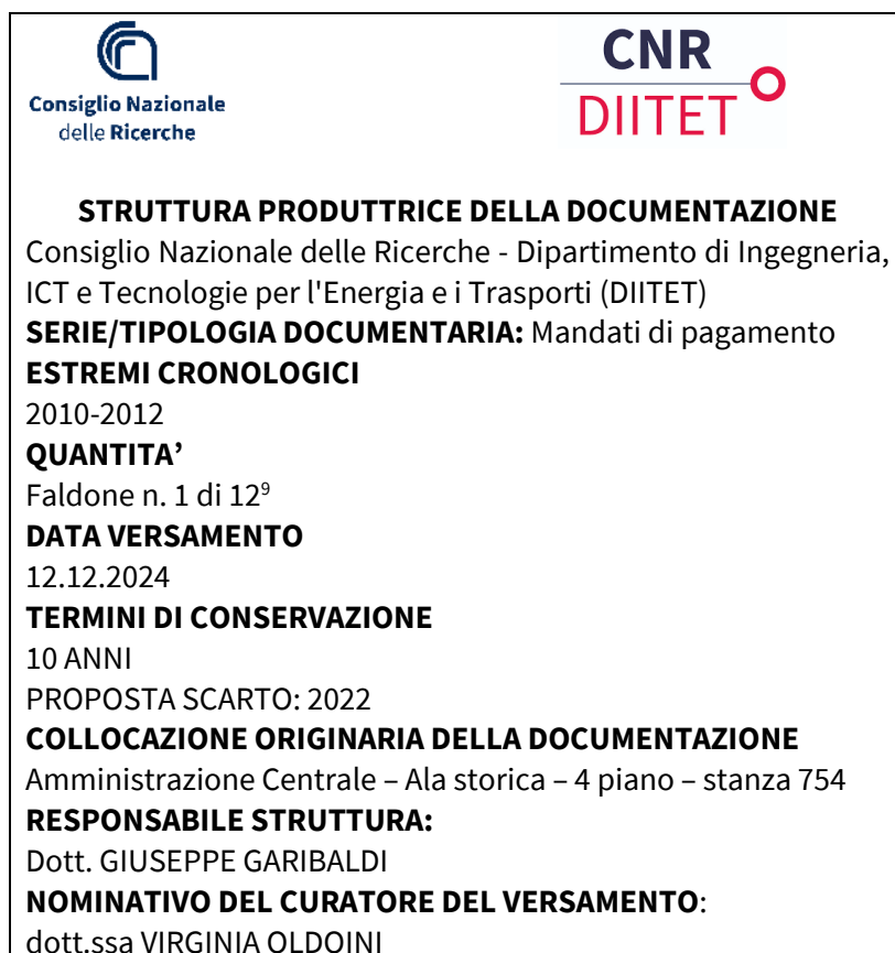
Fig. 1 Modello di etichetta da apporre su faldoni/raccoglitori destinati al versamento.

2. È da evitare l'utilizzo di sigle (es. MdP) o abbreviazioni o di acronimi in quanto non descrivono il contenuto del documento e non corrispondono alle tipologie documentarie elencate nel citato Massimario. Ogni unità di conservazione (scatola/faldone, etc.) oggetti di versamento deve avere un'etichetta adesiva posta sul lato lungo e sul lato corto; anche il faldone, se conservato senza scatola di contenimento, dovrà essere etichettato sul dorso come da Figura 2.