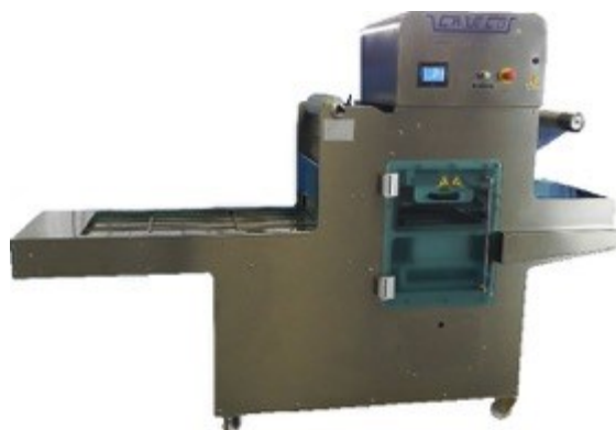
Figura 1a - Aspetto esterno della Termosaldatrice

Il confezionamento di tali prodotti avverrà attraverso una termosaldatrice automatica (Mod. YPSILON) prodotta dalla ditta CA.VE.CO. srl (Figg.1a/b) le cui dimensioni sono le seguenti: larghezza 220 cm, altezza 180 cm profondità 90 cm, peso circa 700 kg.