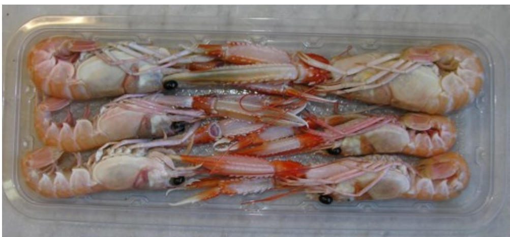
Figura 4 -Vaschetta ad alta barriera all'ossigeno (PP/EVOH/PE) scelta per la fase di sperimentazione. A differenza di quanto mostrato nella foto il colore finale del vaschetta sarà nero.