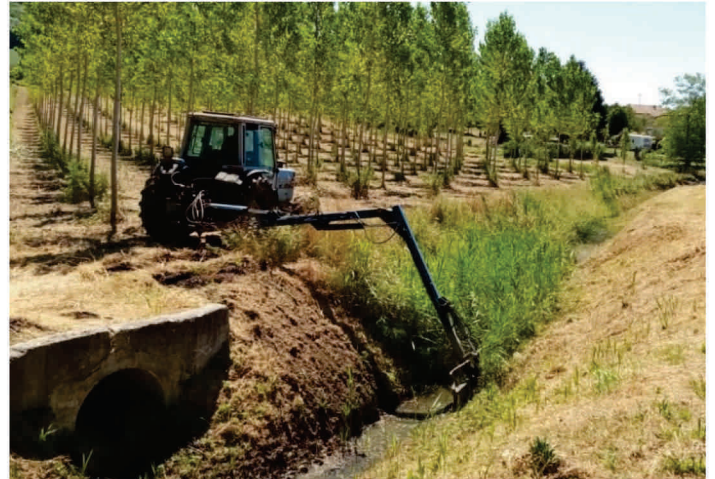
Rio Botro della Tosola - Palaia (PI)