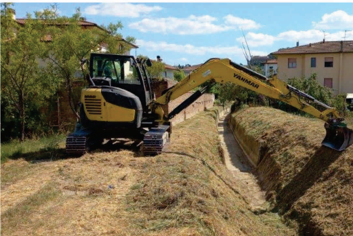
UIO Egola e Montalbano