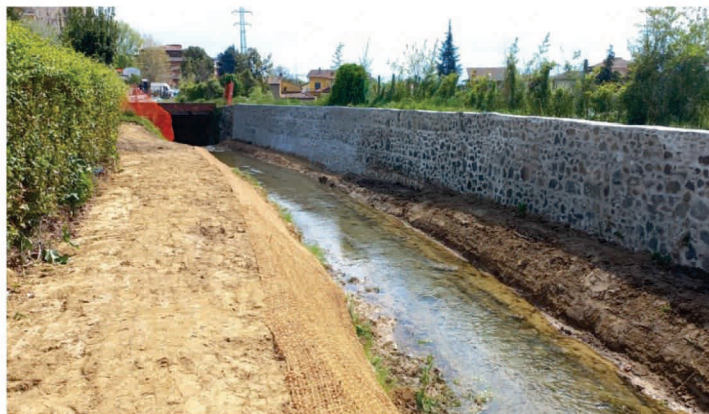
UIO Valdinievole Rio Borra Montecatini Terme/Massa e Cozzile (PT)