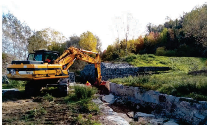
UIO Egola e Montalbano Rio Orlo Castelfiorentino (FI)/San Miniato (PI)