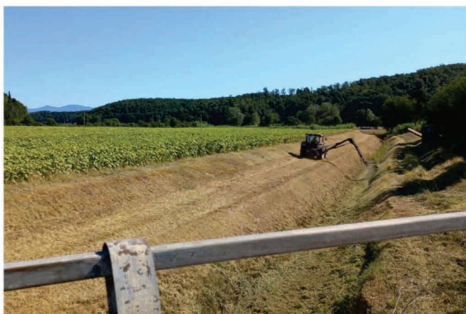
UIO Colline della Valdara Rio Tanna Collesalveti (LI)