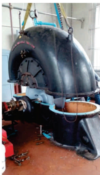
Elettropompa a chiocciola Idroforo Ragnaione Località Coltano - Pisa (PI)