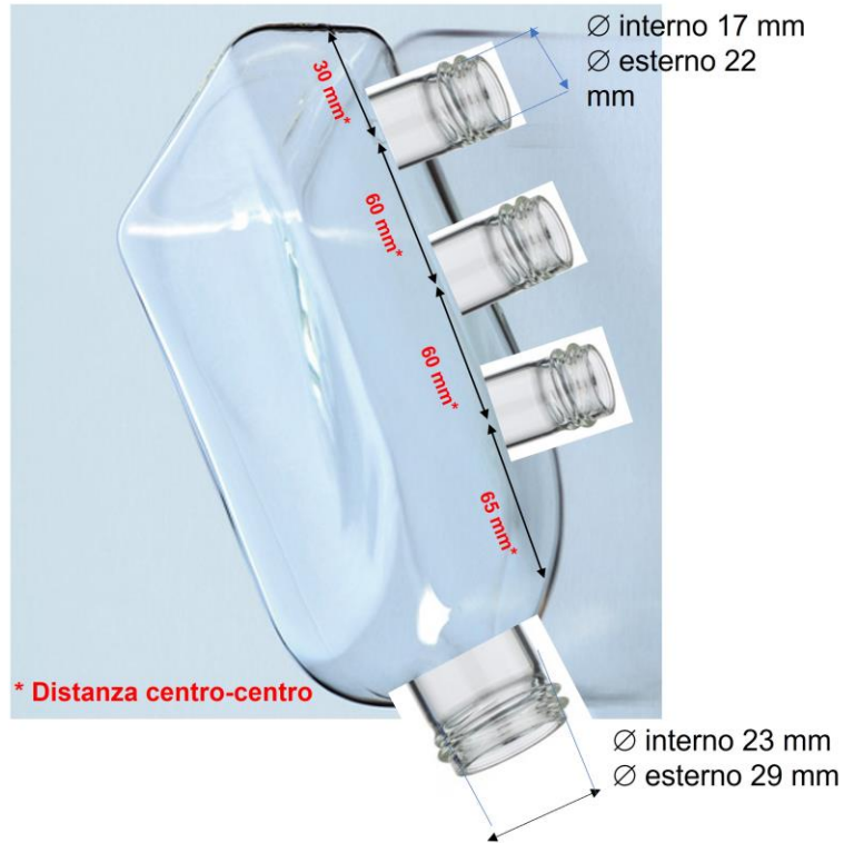
Foto2 - fiasca con lavorazione sul piano