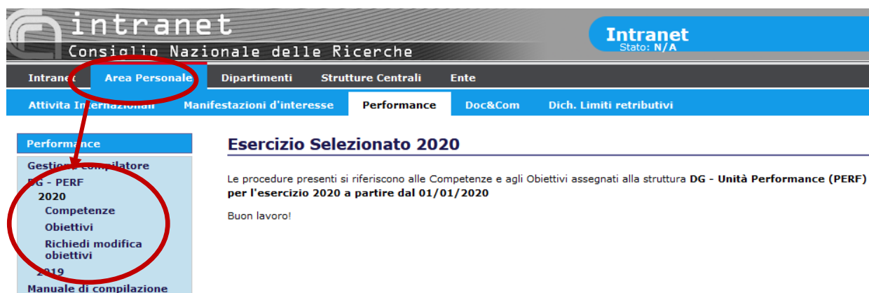
esempio di schermata per la rendicontazione obiettivi

La rendicontazione degli obiettivi sarà effettuata all'interno di SIGeO, sempre all'interno della intranet CNR https://intranet.cnr.it nella sezione "Area Personale" – "Performance" – "Obiettivi".